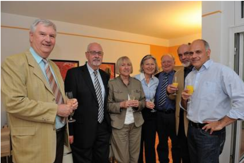
Vorstand im neuen Hospizbüro - Juni 2009